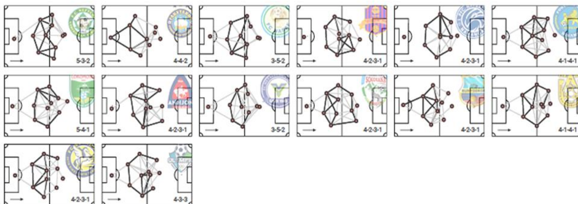
1-rasm. Superliga jamoalarning eng ko'p foydalanadigan sxemalari

Tadqiqotimiz davomida Neftchi Farg'ona jamoasi 2024-yilgi mavsumda ilmiy yondashildi va o'quv-mashg'ulot va musobaqa faSuperati joriy qilingan modellar taklif etildi. Jamoa o'yin strategiyasida barqaror himoya va raqibning xatolaridan foydalanishga asoslangan modelni qabul qildi. Wyscout ma'lumotlariga ko'ra, jamoaning asosiy taktik sxemasi 5-3-2 bo'lib, umumiy o'yinlarning 54.8% qismida aynan shu joylashuvdan foydalanilgan. Bu ko'rsatkich jamoaning kuchli himoyaviy struktura va qarshi hujum strategiyasiga tayanishini yaqqol ko'rsatadi.