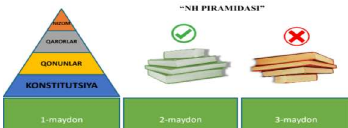
2-rasm. Normativ hujjatlar piramidasi mashqi.

Ushbu mashq orqali tinglovchilar faoliyatda normativ hujjatlarga amal qilish tartibini o'rganib, ularning ketma-ketlik asosida faoliyatda qo'llash ko'nikmalari rivojlanadi. Bundan tashqari ushbu mashq tinglovchilarning jamoaviy ishlash, kreativ va nostandart fikrlash ko'nikmalari takomillashishiga ham xizmat qiladi.